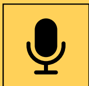
Rádio Amadorismo (Comunicações)